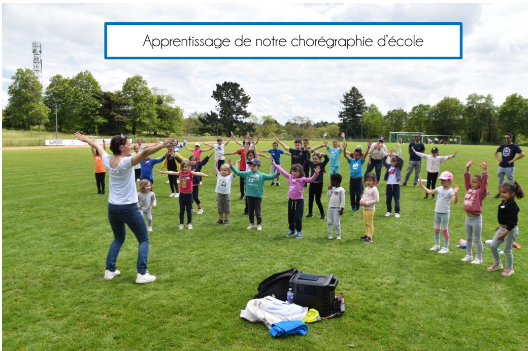
Apprentissage de notre chorégraphie d'école