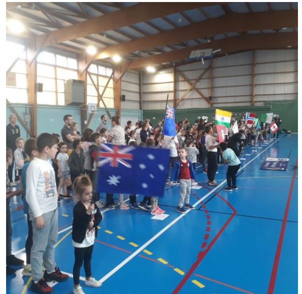
Défilé des équipes