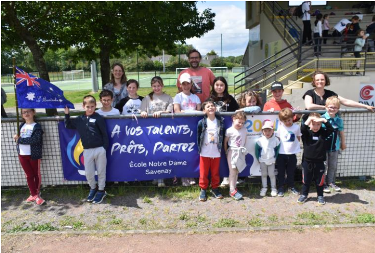
Une des 28 équipes inter-âges