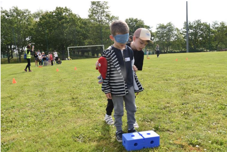
Le paralympique à l'honneur