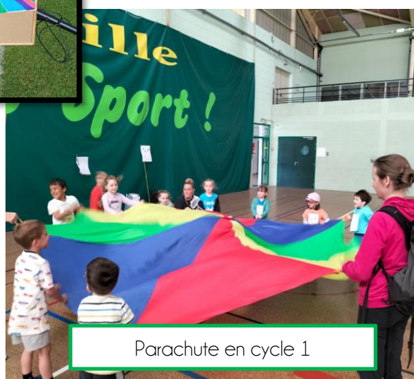
Parachute en cycle 1