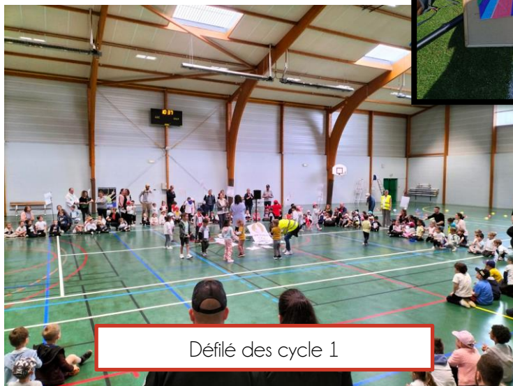
Défilé des cycle 1